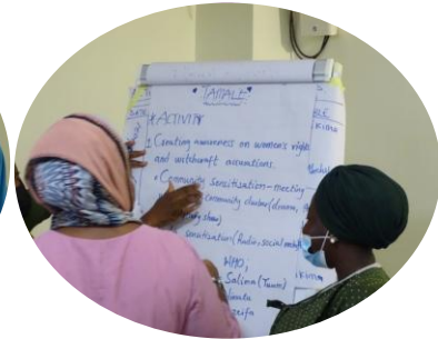
ADFRaD-Workshop Schulung von Multiplikatoren und Interessenvertretern über den Umgang mit Fällen von Hexerei-Anschuldigungen