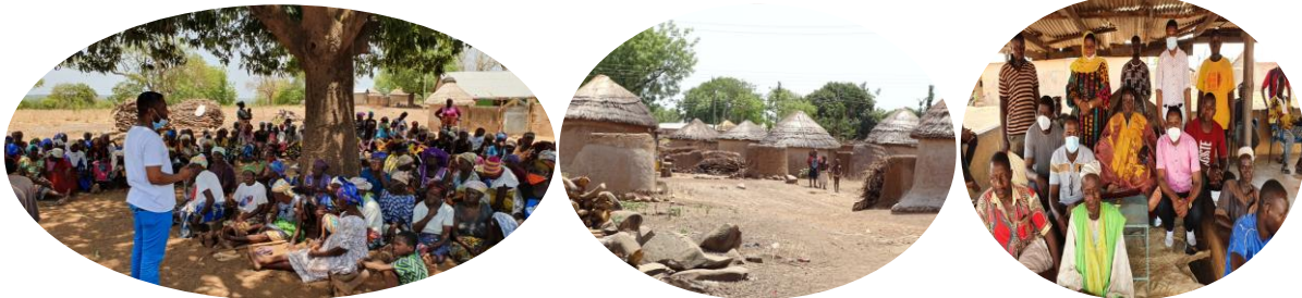
Sensibilisierung von Frauen und Gemeinschaften für ihre Rechte und Anschuldigungen wegen Hexerei

Sie haben Gespräche mit Opfern von Hexerei-Vorwürfen, traditionellen Autoritäten und anderen Gemeindemitgliedern geführt und sich mit ihnen ausgetauscht. Interviews wurden auch mit Opfern von Hexerei-Praktiken geführt. Auch sie wurden über ihre Rechte sensibilisiert und informiert.