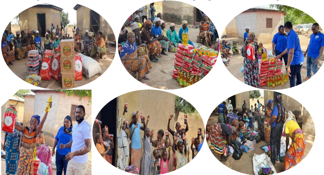
Veränderung der Lebensumstände durch sofortige Hilfe für beschuldigte Opfer

Dem Besuch in dem Lager war eine Live-Übertragung im Radio und Fernsehen am Morgen in Tamale vorausgegangen. Das Hauptaugenmerk beider Sendungen lag auf den Nachhaltigkeitsmaßnahmen und den Reintegrationsperspektiven für die Opfer in den Lagern.