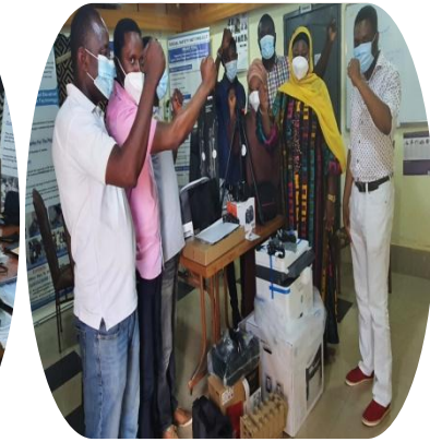
ADFRaD Übergabe von Büroausstattung für Projektdurchführung