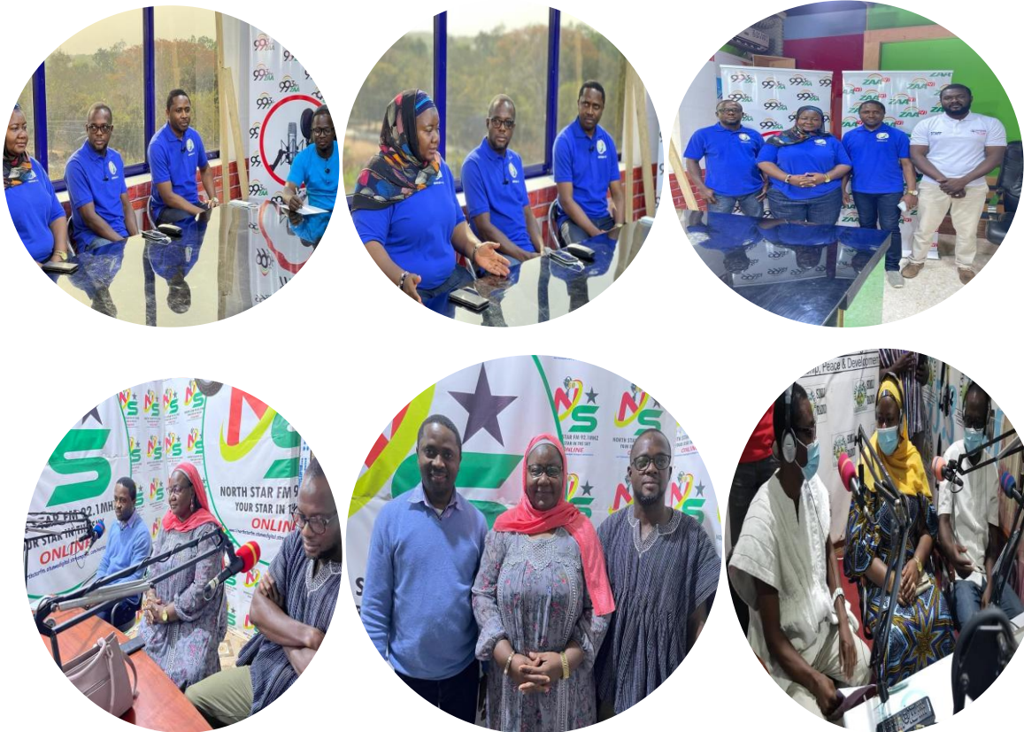
ADFRaD und Sontaba sensibilisieren für Hexereipraktiken

Das Medienprogramm wurde sowohl in Englisch als auch in Dagbanli abgehalten. Das Team hat deshalb über Radio und Fernsehen die Öffentlichkeit über Hexereipraktiken und damit verbundene Menschenrechtsverletzungen aufgeklärt.