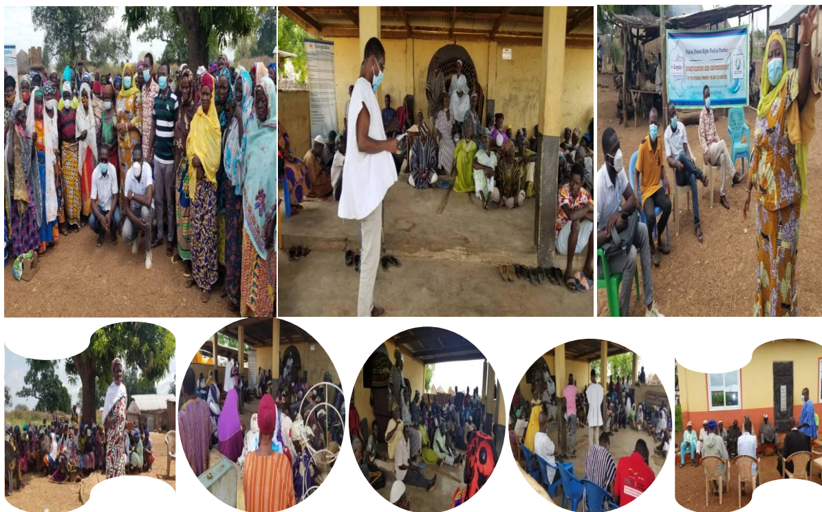
GIZ, Sontaba, ADFRaD und Multiplikatorinnen engagierten sich für die Beendigung von Hexenverfolgungsvorwürfen und Gewalt gegen Beschuldigte.

Mit der Bezirksversammlung in Yendi, Tamale, fand ein Treffen zum Austausch über die Zusammenarbeit zwischen staatlichen Einrichtungen und Organisationen der Zivilgesellschaft und die Unterstützung von beschuldigten Frauen in den Lagern statt.