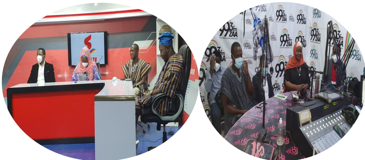
ADFRaD und Songtaba_Bewusstseinsbildung durch Medienengagement

Während des Projektworkshops wurden insgesamt 4 Medienveranstaltungen im Fernsehen und im Radio live übertragen, wobei mehrere Anrufer und Zuhörer erreicht wurden.